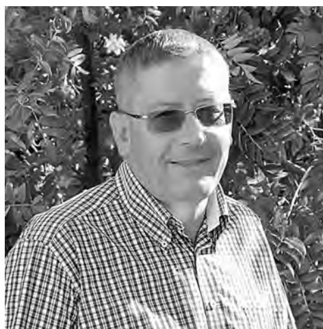
■ Глава города Гурьевска Михаил Поданев.

А планы между тем грандиозные: планируется обустроить подъезд к роднику, сделать автостоянку, сложить купель и колодец для забора воды. Чуть поодаль от родника будет построена раздевалка, часовенка, при ней – иконная лавка. На месте забора воды установят кованую беседку. В перспективе здесь будет освещение, дорожки, клумбы, лавочки.