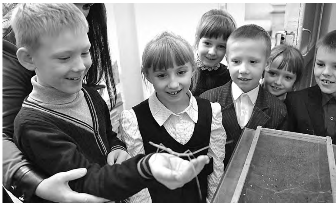
■ Фото Ярослава Беляева.