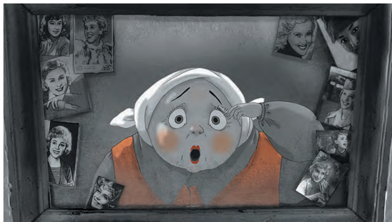
■ Кадр из фестивальной ленты «В стороне».

Приз организаторов: «Мама» (режиссер Кирилл Плетнев, Москва);