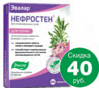
Нефростен №60, таб.**