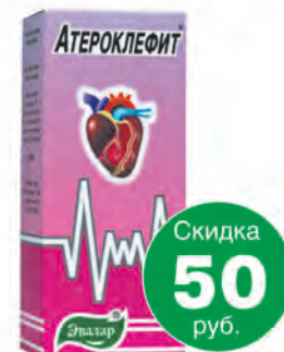
Атероклефит, 100 мл.*