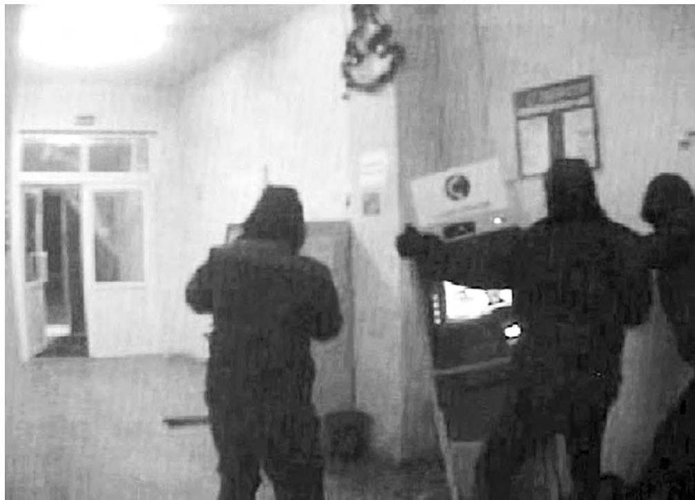
■ Момент кражи банкомата в Промышленновском районе, который зафиксировала установленная в помещении камера видеонаблюдения.

Вскоре после задержания с одним из участников банды было заключено досудебное соглашение о сотрудничестве, и он активно содействовал следствию, дав признательные показания, изобличающие как свою преступную деятельность, так и криминальные «подвиги» своих подельников. Из-за этого возникла угроза личной безо-