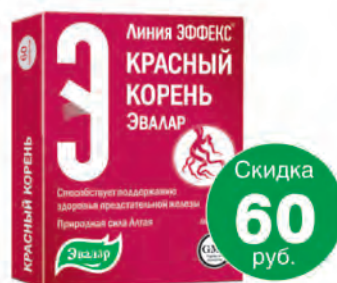
Красный корень, №60, таб.**