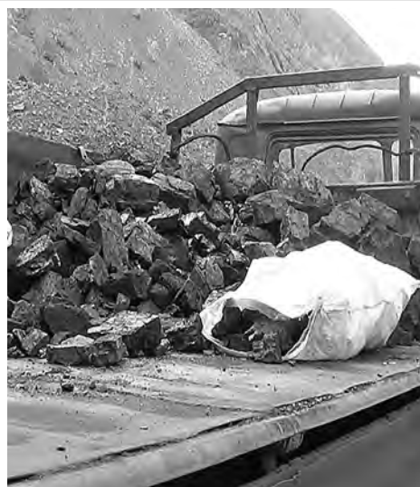
■ Украденный уголь, который воришки не успели сбыть.

С точки зрения Уголовного кодекса Российской Федерации действия самодельных шахтеров были расценены как «кража, совершенная группой лиц по предварительному сговору», за что в отношении них в отделе полиции «Зенковский» было возбуждено уголовное дело. Теперь «черным углекопам» в качестве наказания грозит до пяти лет лишения