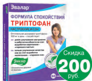
Формула спокойствия Триптофан №60, таб.**

Акция проводится в аптеках: Эвалар Кемерово - 54-93-22, 52-45-42, 61-31-28, 62-37-06, 38-72-77; Эдельвейс 53-90-90 (справка), Аптека Кемерово 31-59-16, 64-78-48, 38-49-02, 73-35-28; Мир медицины 57-54-14, 37-52-37; г. Топки - 3-16-37, 4-73-21, 4-55-56; г. Березовский - 3-28-89; г. Ленинск-Кузнецкий - 3-03-00, Мир медицины 2-10-64, 5-20-22; г. Белово - 2-68-69; г. Юрга - 4-44-05; г. Прокопьевск - 66-79-49, 61-34-00.