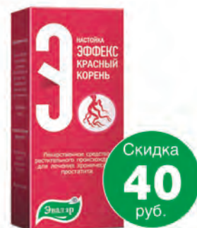
Эффекс Красный корень настойка, 100 мл.*