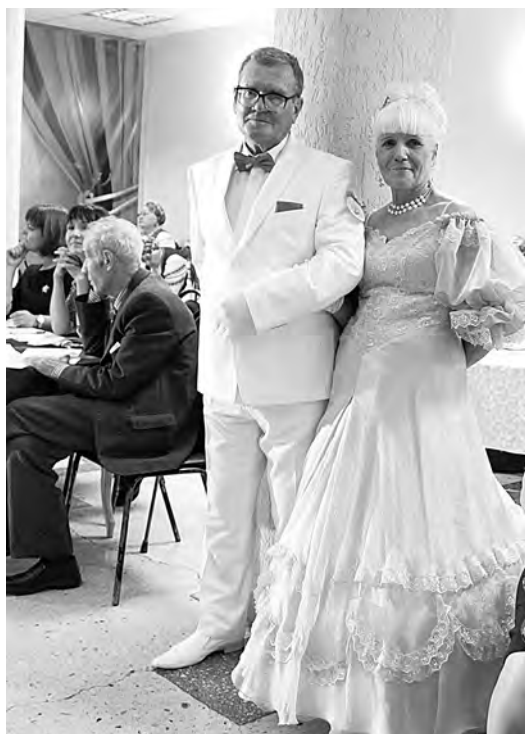
■ Участники фестиваля помимо танцевальной программы не забыли подумать и о соответствующих нарядах.

- Мы приготовили для конкурса вальс из опе-