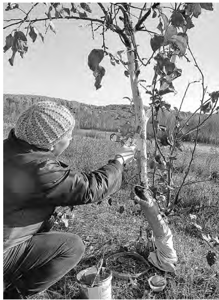
■ Садоводы в первую очередь стараются обезопасить яблони от набегов мышей.

Для особо нежных растений — можжевельников виргинского, чешуйчатого, туи, декоративных елей, рододендронов — неплохо соорудить решетчатые каркасы — укрытия. Они будут с успехом задерживать снег, кроме того, на них легко набросить укрывной материал, который предохранит крону от выгорания.