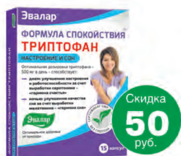
Формула спокойствия Триптофан №15, таб.**