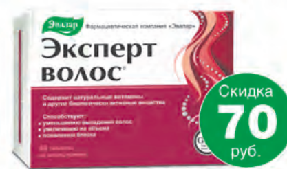
Эксперт волос №60, таб.**

Период проведения акции с 1 по 30 октября 2016 г. Предложение действительно при наличии товара в аптеке.