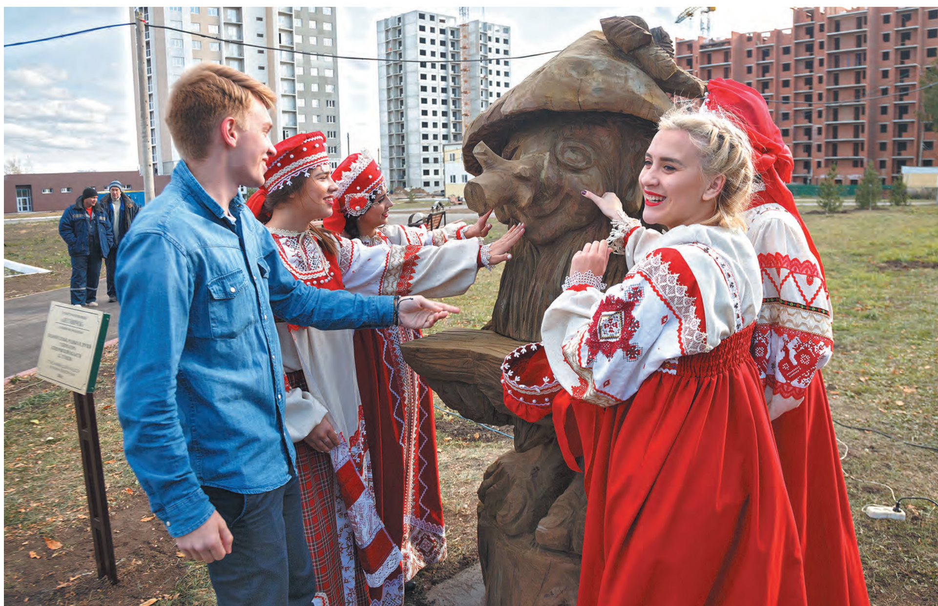
«Лесовичок» стал настоящим украшением агропарка.