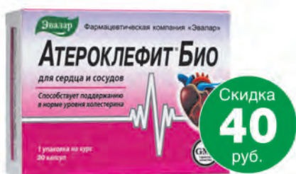
Атероклефит Био №30, капс.**