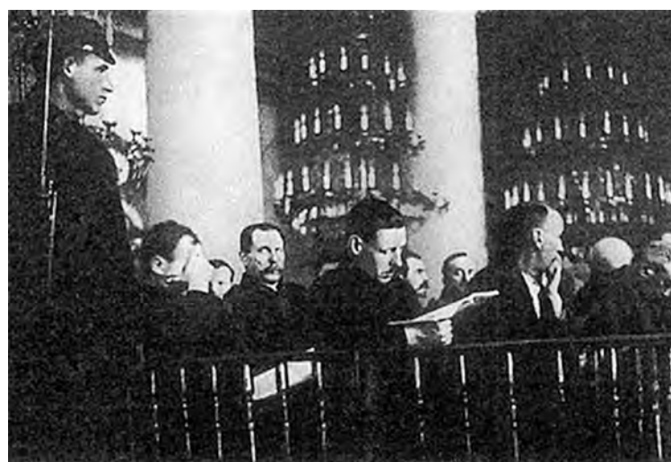
■ Суд над Арнольдом и другими обвиняемыми исторического судебного процесса, январь 1937 года.

– Ред. ) Но осенью 1936-го Арнольда арестовали за то, что ДТП в 1934-м было... покушением на Молотова.