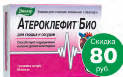
Атероклефит Био №60, капс.**